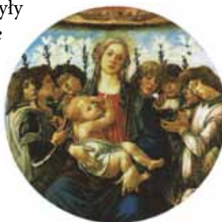
Madonna z dziećmi Sandro Botticelliego – przedmiot sporu polsko-niemieckiego w okresie międzywojennym.