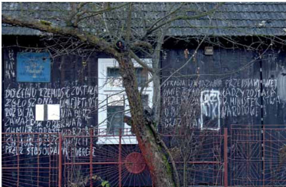
Ściana frontowa domu.

Chociaż Erich Fromm uważał, że „wszyscy jesteśmy szaleni i dlatego każdy uważa się za normalnego” 3 , nadal czy to indywidualnie, czy też w ramach społeczności ludzie przypinają etykiety anormalności jako przeciwieństwo określania własnego bytu. Jest to automatyczny odruch towarzyszący nam w spotkaniu z niezrozumiałym zachowaniem, którego główną cechą, w naszym mniemaniu, jest absurdalność. Zachowania odbiegające od powszechnie przyjętych standardów, odmienność, dziwactwo, nieuzasadnione odosobnienie, nieprzewidywalność czynów i reakcji 4 są synonimami szaleństwa i jako takie stanowią główny powód stygmatyzacji. Szaleniec wyłamuje się z porządku kultury, który określają jej wzory, różnicowane poprzez przestrzeń geograficzną i charakterystyczne wyłącznie dla danego czasookresu. „Jakże często w perspektywie czasu szaleństwo okazuje się rozumem, a trzeźwość – szaleństwem” 5 .