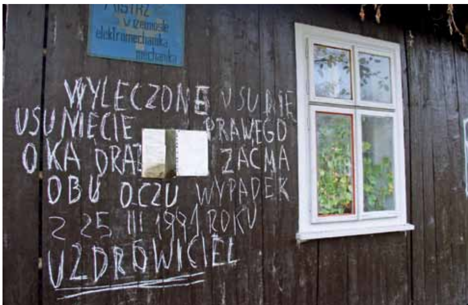
Informacje na ścianie domu świadczące o cudownych zdolnościach jego właściciela (autor M. Wójtowicz-Wierzbička).

i ciekawość tajemnicy, jaką nosi w sobie wyrzutek. Powtarza się tutaj znane twierdzenie o tym, że nawet nieświadomie możemy sami „(...) zaludniać czyjąś wyobraźnię, możemy żyć w niej... tak naprawdę żyjąc zupełnie gdzie indziej” 21 .