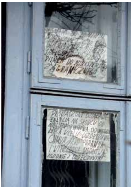
Zapiski ujawnione w oknie (autor M. Wójtowicz-Wierzbička).

Wyobrażenia to czasem azyl dla takich współczesnych «Jonaszów», którzy czują się jeszcze zbyt słabi do wykonywania odpowiedzialnych zadań. Często nie wydobywają się z tego «wielorybiego brzucha» nigdy. Wtedy społeczeństwo przypina im etykietkę szaleńców. Czasami piszą pasjonujące raporty z tego, co widzieli w świecie wyobraźni, a niektórzy z nich zyskują miano geniuszy. Granica jest bardzo trudno uchwytna 14 .