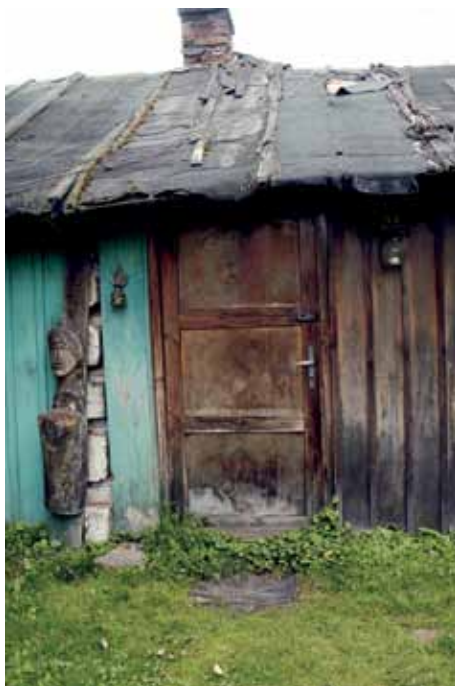
Wejście do domu (autor M. Wójtowicz-Wierzbička).

ktos z niego śmieje. Podobno kiedy pod sklepem zażartował z niego jakiś wyrostek, Kazek, bez zbędnych słów, jednym wprawnym ruchem przerzucił go przez płot. Od tej pory nikt w jego obecności nie odważył się z niego zadrwić. Przestrzegano nas także przed wizytą u niego, chociaż – dodawano – w końcu nie jesteście stąd, to może wam nic nie zrobi. On bardzo dba o swoją opinię, zastrzegł, byśmy nie robili zdjęć obejścia, gdyż wie, że to mogłoby mu zepsuć reputację wśród mieszkańców wsi. Mówi: „nie bardzo, bo to idzie opinia, ja w ogóle uczęszczam do lekarzy, z nauczycielami mam sprawę nierozstrzygniętą. Sami wrogowie!”. To właśnie ci mityczni wrogowie wypełniają