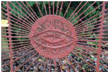
Fragment ogroduzenia (autor M. Wójtowicz-Wierzbicka).

ludziom wydaje się, że przyczyną szaleństwa jest wielkie i dramatyczne wydarzenie, jakieś cierpienie, którego nie da się znieść. Wydaje im się, że wariuje się z jakichś powodów – z powodu porzucenia przez kochanka, śmierci najbliższej osoby, utraty majątku, spojrzenia w twarz Boga. Ludzie myślą, że wariuje się nagle, od razu, w niezwykłych okolicznościach, a szaleństwo spada na człowieka jak siatka-pułapka, pęta rozum, mąci uczucia 17 .