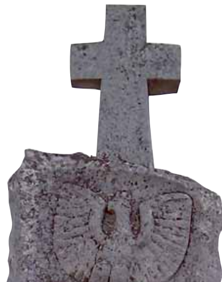
Okolice Karwosiek; fot. P. Jarzyński.