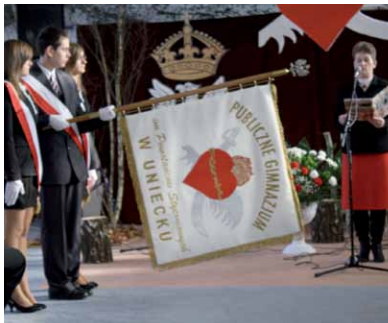
Krajobraz Karwosiek; fot. P. Jarzyński.