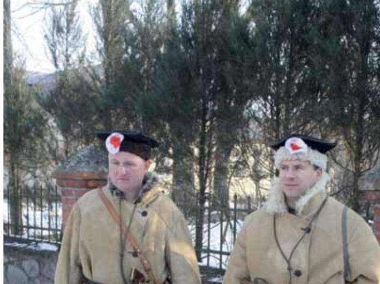
Okolice Włoczewa; fot. P. Jarzyński.

W Trzebuniu znajdziemy się na końcu ozu, a jednocześnie na początku rynny. To właśnie tutaj kanał biegnący pierwotnie we wnętrzu lodowca wniknął w podłoże i rozpoczął rzeźbienie rynny. W początkowym odcinku jest to zaledwie małe zagłębienie wypełnione kilkoma drobnymi stawami, stanowiącymi rezerwuary wody niemalże w centrum wsi. Dopiero gdy idąc drogą na zachód minimy zabudowania Trzebunia, roztoczy się przed nami widok doliny będącej znaczącym już komponentem krajobrazu. Znajdziemy się na dnie jednego z dwóch początkowych ramion rynny. Połączą