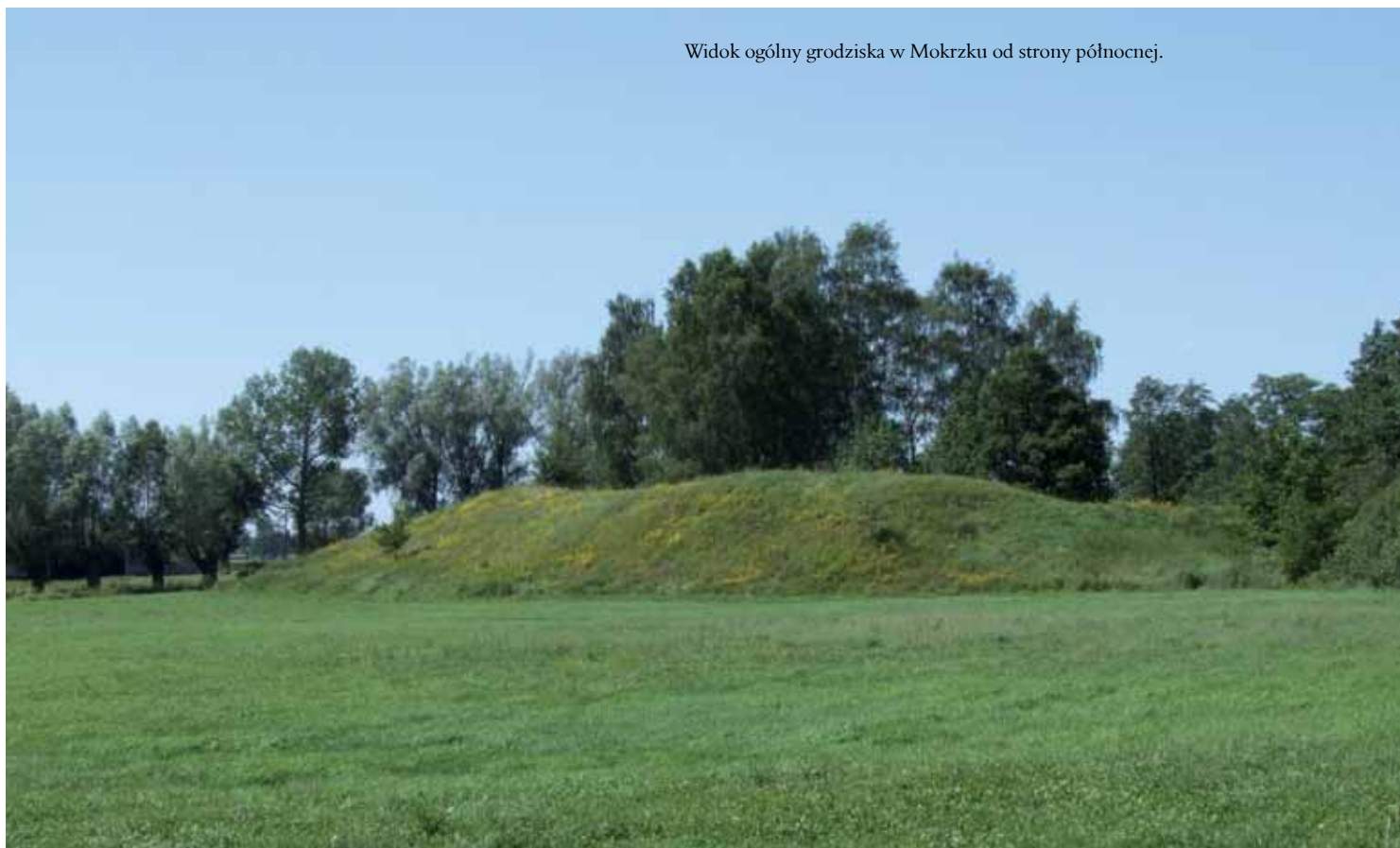
Widok ogólny grodziska w Mokrzku od strony północnej.