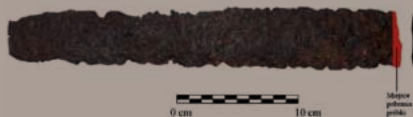
Ryc. 2. Widok ogólny fragmentu głowni mieczowej z Pilichowa, pow. płocki; fot. P. Pudło.

Na podstawie przeprowadzonych analiz mikroskopowych (ryc. 2) można wnioskować, że badany miecz został wykonany