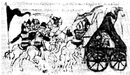
Ryc. 3. Dom Połowców na wozie – Miniatura Radziwiłłowskiej Letopisi