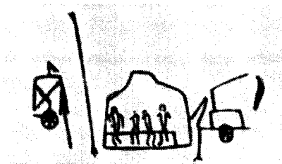
Ryc. 3. Dom Połowców na wozie – Miniatura Radziwiłłowskiej Letopisi