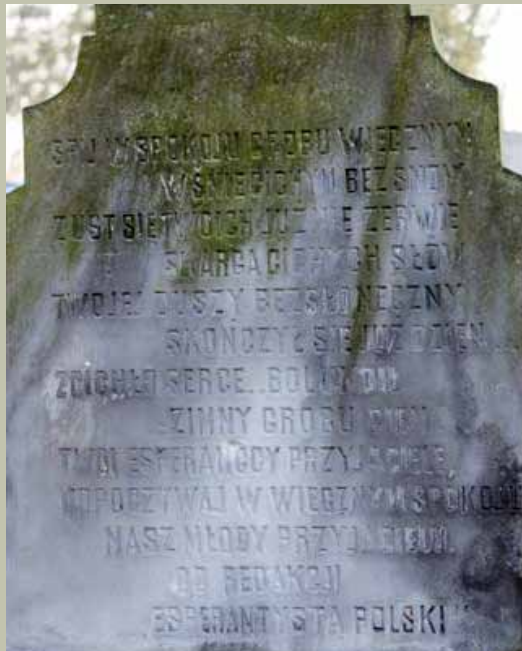
Tylna strona tablicy nagrobnej z inskrypcją w języku polskim.