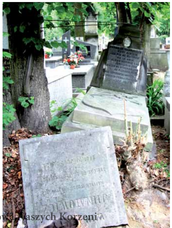
Grób Zenona Ihnatowicza; fot. K. Matusiak.