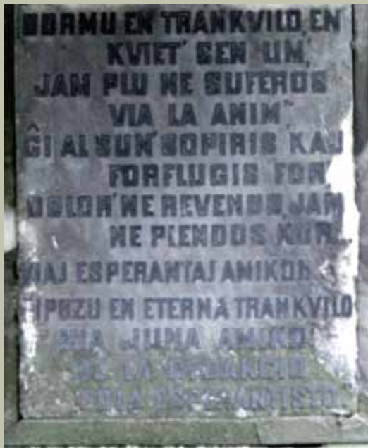
Przednia strona tablicy nagrobnej z inskrypcją w języku esperanto.