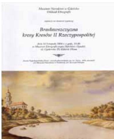
Zaproszenie na wystawę „Brasławszczyzna kresy Kresów II Rzeczypospolitej”