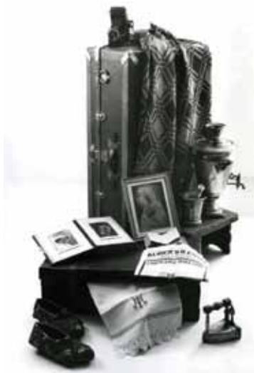
Obiekty z wystawy „Co kryły walizki repatriantów?” (autor R. Petrajtis)

Muzeum Etnograficzne w Gdańsku Oliwie z powodzeniem prezentowało od 1998–2008 roku cykl wystaw kresowych, przybliżających historię i pamięć o dużym obszarze ziem II Rzeczypospolitej odciętych w wyniku konferencji jałtańskiej. Nasuwa się pytanie, czy muzeum etnograficzne powinno zajmować się taką tematyką, bądź co bądź bardziej pasującą historykom. Odpowiedź jest oczywista, bowiem w sytuacji wielkiej pustki w tych zagadnieniach, będącej schedą socjalistycznej przeszłości, niejako obowiązkiem każdego muzealnika jest ochrona nie tylko przedmiotów przywiezionych w repatrianckich bagażach, ale nade wszystko pamięci. Wystawy muzealne poprzez materię zakłęta w przedmiotach bezpośrednio pozyskiwanych na cele ekspozycyjne od osób prywatnych, budują zawsze pewną opowieść o tamtych czasach, ludziach i miejscach. Zderzenie zwiedzającego z taką wystawą – opowieścią stworzoną przez muzealnika, daje iluzję rzeczywistości, przywołuje zapomniane obrazy, odwołuje się do emocji i sentymentu. Natomiast dla młodego pokolenia Polaków wystawy kresowe są cenną lekcją zbyt mało ciągle nauczanej najnowszej historii, uświadomienia trudnych losów ich przodków, od-