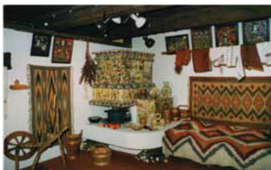
Aranżacja izby huculskiej na wystawie „Odkrywanie Huculszczyzny”