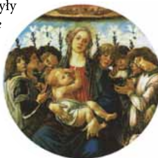
Madonna z dzieciątkiem Sandro Botticelliego – przedmiot sporu polsko-niemieckiego w okresie międzywojennym.

Podstawą rewindykacji archiwaliów z Austrii były postanowienia traktatu w Saint-Germain-en-Laye z 10 września 1919 r., który – w art. 93 – nakazywał zwrot archiwaliów dotyczących dzielonych terytoriów z ostatnich 10 lat między Królestwo Serbów-Chorwatów-Słoweńców, Rumunię, Czechosłowację i Polskę (jedynie Włochom zobowiązano się zwrócić akta od roku 1861). Z kolei art. 189 przyznał państwom-sukcesorom „bezsprzeczne i nieodwołalne prawo do wszystkich akt, odnoszących się do wszystkich gałęzi administracji”.