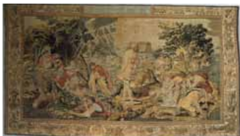
Arras wawelski „Potop” (ok. 1550 r.) odzyskany z Rosji radzieckiej w 1922 r.

Zgodnie z prawem międzynarodowym w odniesieniu do Rosji Radzieckiej zagadnienie rewindykacji i repatriacji – po zwycięskiej wojnie 1920r. – unormował art. XI traktatu ryskiego z 18 marca 1921 r. wraz z instrukcją wykonawczą 21 . Przewidywał on zwrot Polsce wywiezionych w okresie zaborów dóbr kulturalnych, a zwłaszcza bibliotek, księgozbiorów, zbiorów archeologicznych i archiwalnych, dzieł sztuki oraz wszelkiego rodzaju dokumentacji i archiwaliów państwowych, urzędowych, samorządowych lub prywatnych, związanych z ziemiami Rzeczypospolitej Polskiej w granicach z 1921 r., a zwłaszcza tych, które zostały ewakuowane w okresie I wojny światowej. Jednakże przedmioty wchodzące w skład kolekcji, których wartość wynikała z ich określonej całości (np. księgozbiór, zbiór rękopisów) i które stanowiły określoną wartość kulturalną w skali światowej, nie podlegały przekazaniu i miały być zastąpione ekwiwalentnymi