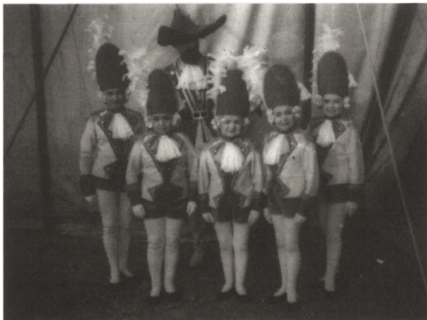
Fot.: Z grupą współpracujących kobiet – liliputek

Do dzisiaj spotykam ludzi, którzy oglądali go na arenie cyrkowej lub potem na imprezach choinkowych dla dzieci. Jako jeden z nielicznych w tamtych czasach obywateli PRL miał możliwość wyjazdów za granicę, nie tylko ZSRR i KDL, ale też zupełnie egzotycznych, jak Cypr, Egipt. Dość wcześnie przeszedł na emeryturę z powodu rozwoju zaćmy. Późniejsza operacja, na tamte czasy poważny zabieg, uniemożliwiła mu dalszą pracę w warunkach polowych. Już jako emeryt udał się w podróż swojego życia, transatlantykiem Batory. Tam też wziął udział w pokazach artystycznych pasażerów. Po śmierci w 2002 r. zostawił po sobie albumy ze zdjęciami, dokumenty i rekwizyty, które powędrowały do jego kolegów po fachu. Zanim zaćma uniemożliwiła mu ostre widzenie