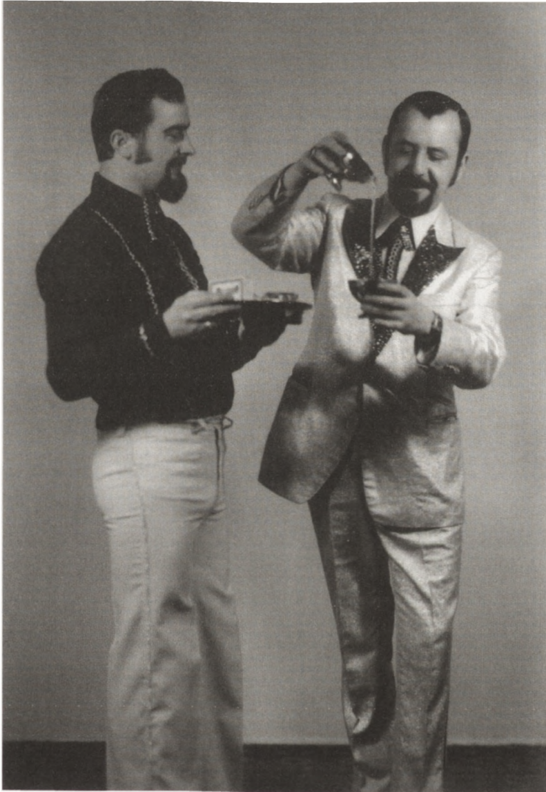
Fot.: Podczas pokazu iluzji, wraz ze współpracownikiem

kształtów i kolorów, zajmował się krzyżkowym haftem artystycznym. Obrazy malowane nicią są w posiadaniu rodziny i znajomych, zdobiąc nasze mieszkania. Był także zapalonym grzybiarzem i wszędzie tam, gdzie trasa wiodła przez grzybne lasy (również w okolicach Mińska), pieczolowicie czyścił, suszył i rozdawał potem rodzinie oraz znajomym pięknie opakowane własnoręcznie malowanymi ilustracjami.